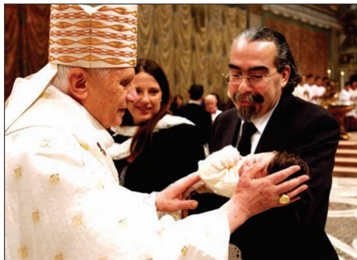
Riba e foto, duna pa e corant Vaticano L'Osservatore Romano, Papa Benedict XVI, ta batisa un mucha durante e ceremonia den e kapel Sistina na Vaticano diadomingo. Papa Benedicto XVI a batisa dies mucha recien naci siguiendo e tradicional di Papa Juan Pablo II, personalmente pa yama bon bini na e miembronan nobo di e Iglesia Catolico Romano.

TEHERAN—Iran ta sigui ayera cu e combersacionnan cu Rusia riba e proposicion di Moscu di enriquece Uranium riba suelo Rusiano, mientras cu Teheran ta prepara pa bolbe cuminsa cu su actividadnan nuclear desafiando asina e Agencia Internacional di Energia Atomico. (AIEA) E proceso di e negoshacionnan ta positivo y potencialmente por desemboca den plannan efectivo, e portabos di e ministerio Irani, di Relacionnan Exterior, hamid Reza Assefi a bisa den su habitual rueda di prensa. Un delegacion Moscovita a cuminsa diasabra , negoshacionnan cu Teheral riba e plan Rusiano pa Iran enrikece uranium pero riba e teritorio Rusiano. E proposicion apoya pa Estados Unidos y Union Europeo, ta trata di impedi cu Iran lo haci enrikecimiento di e elemento kimico cita , operacionnan base e fabricacion di arma nuclear, den su propio teritorio. Nan ta studiando diferente plannan, Asefi a bisa ora cu el a bisa cu lo esencial ta pa respeta e derechonan di Iran. Iran a declara siman pasa cu e tin programa pa cuminsa retira e precintonan di e centronan di investigacion di uranium.